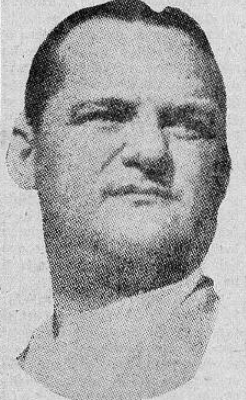
JOSE A. REMON

El promedio de asesinatos políticos de personajes importantes ha sido de uno cada año y medio durante el último siglo, exceptuando a Remón que vivió tres años más que el Ali Kan de Pakistán, asesinado en 1951